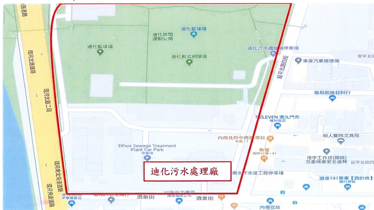
交通路線及位置圖

北區訓練地點：臺北市政府工務局衛生下水道工程處迪化污水處理廠(臺北市大同區酒泉街235號)，詳下圖。